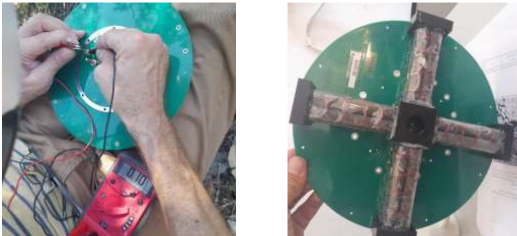
Fig.2. Misure effettuate dall'operatore sulla scheda elettronica (a sinistra). Dettaglio della scheda elettronica difettosa (a destra)